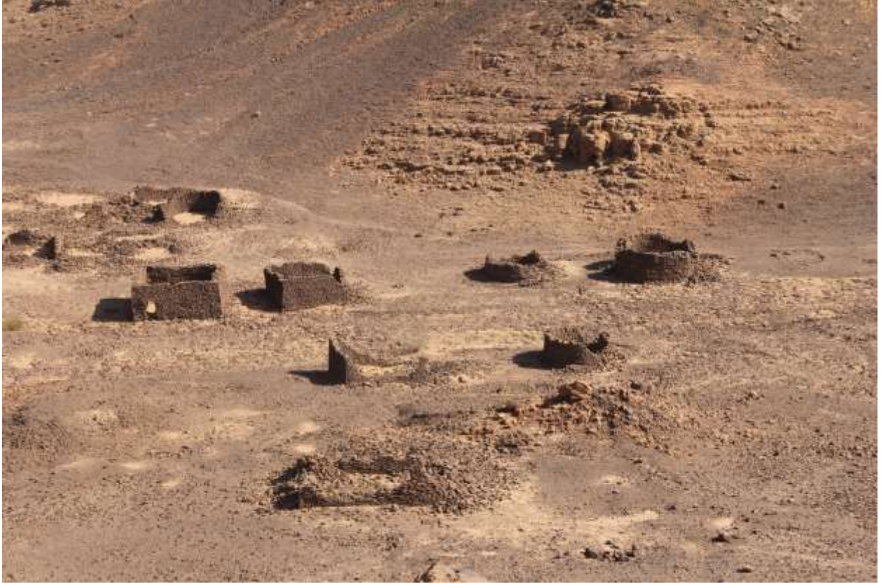
بقايا قرية إسلامية بموقع الشطيبي (E012)