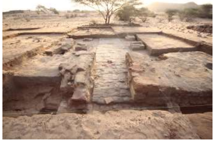
صورة للمباني الداخلي