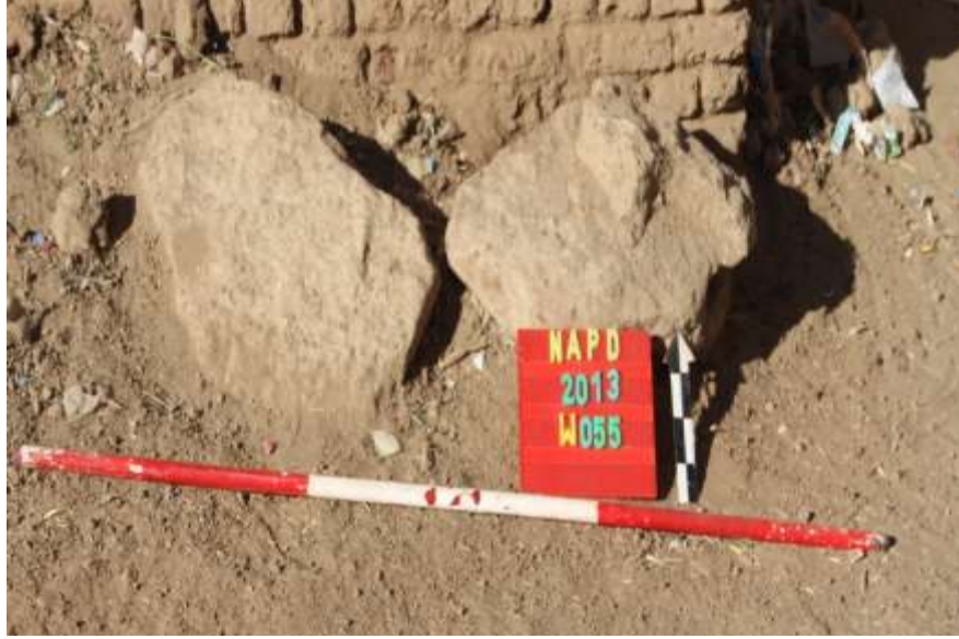
بقايا أعمدة من الحجر الرملي بقرية العقيدة (W055)