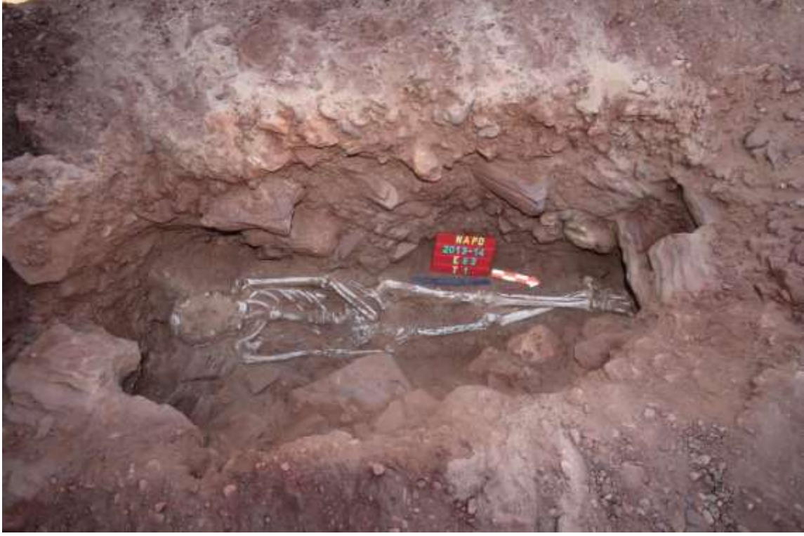
رفات بوضع ممدد بموقع (E063) العالياب الرمتا