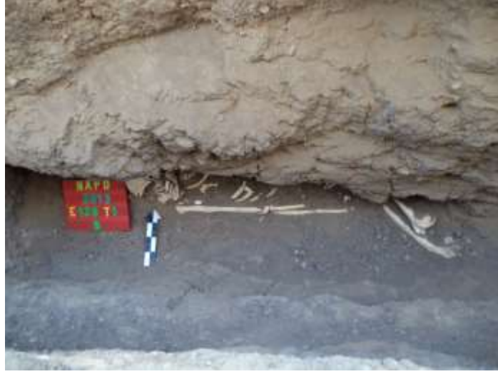
حفرة الدفن بالقبر (T1) بموقع (E129) العالياىب القلعة