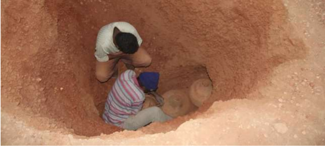
عملية التنقيب بالمقبرة (T16) بالموقع (E067) العالياي حلة كوكو