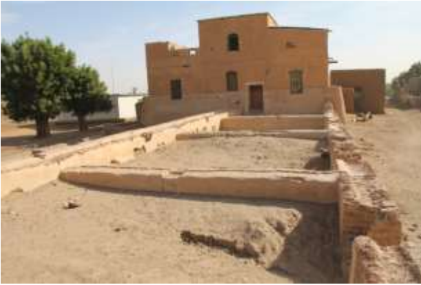
مصبغة الأقمشة والسرايا أم الطيور

نسبة مواقع هذه الفترة تشكل اقل من ١% من المواقع المسجلة حتى الآن. تتمثل هذه المواقع في مصبغتين للأقمشة تقعان بالضفة الغربية للنيل، إحداهما بقرية سقادي غرب وتقع جنوب منطقة المشروع، والأخرى بقرية أم الطيور بشمال المنطقة والتي أضيف إليها مبني آخر من طابقين في فترة لاحقة على الجزء الشرقي منها.