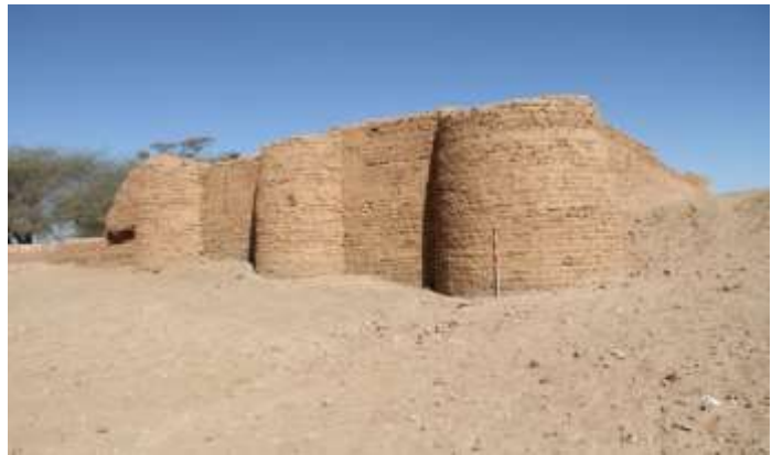
مصبغة الأقمشة بسقادي غرب

مواقع غير مصنفة: بالإضافة للمواقع الأثرية التي تعود للعصور المذكورة سابقا، وجدت نسبة مقدرة من المواقع التي لم تصنف بعد. تزيد نسبة هذه المواقع غير المصنفة عن ٥% من جملة المواقع المسجلة وهي في انتظار مزيد من الدراسات.