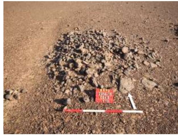
الكوم الخارجي وحفرة الدفن بمقابر (E157) العوضاب المحمية