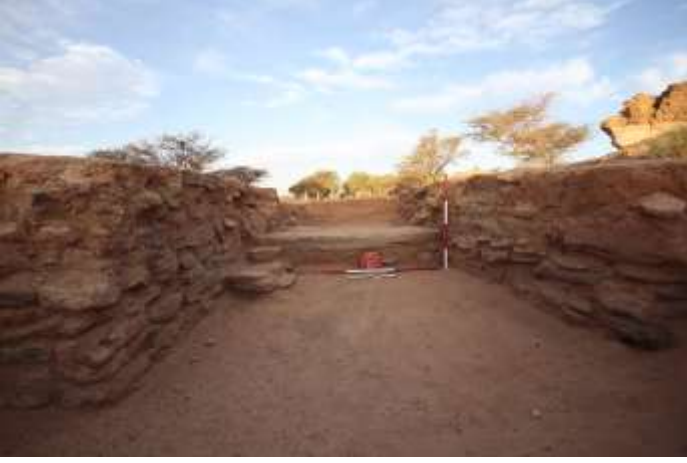
صورة للبوابة الغربية