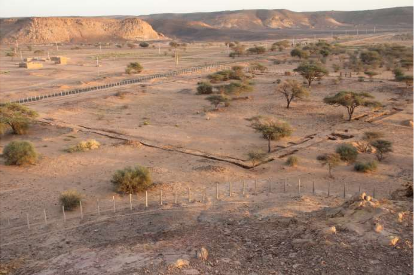
صورة لحوش الكافر من قمة جبل امبور

سور مستطيل مبني من الحجر والطوب الأحمر يحيط بمعظم أجزاء الموقع. تبلغ أبعاد هذا السور ١١٨ متر طولاً X ٩٠ متر عرضاً X ٢٢٠ سنتيمتر سماكاً، وله ٣ بوابات بالجهات الغربية والشرقية والجنوبية. أسفر التنقيب في المنطقة الداخلية للسور عن مباني من الطوب الأحمر، والطوب اللبن، والحجر الرملي، ذات أرضيات من الحجر. يرجح أن يكون هذا المبنى جزء من معبد.