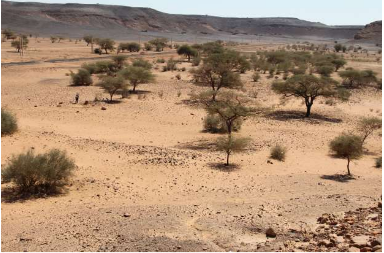
الموقع المروي (E015) حوش الكافر