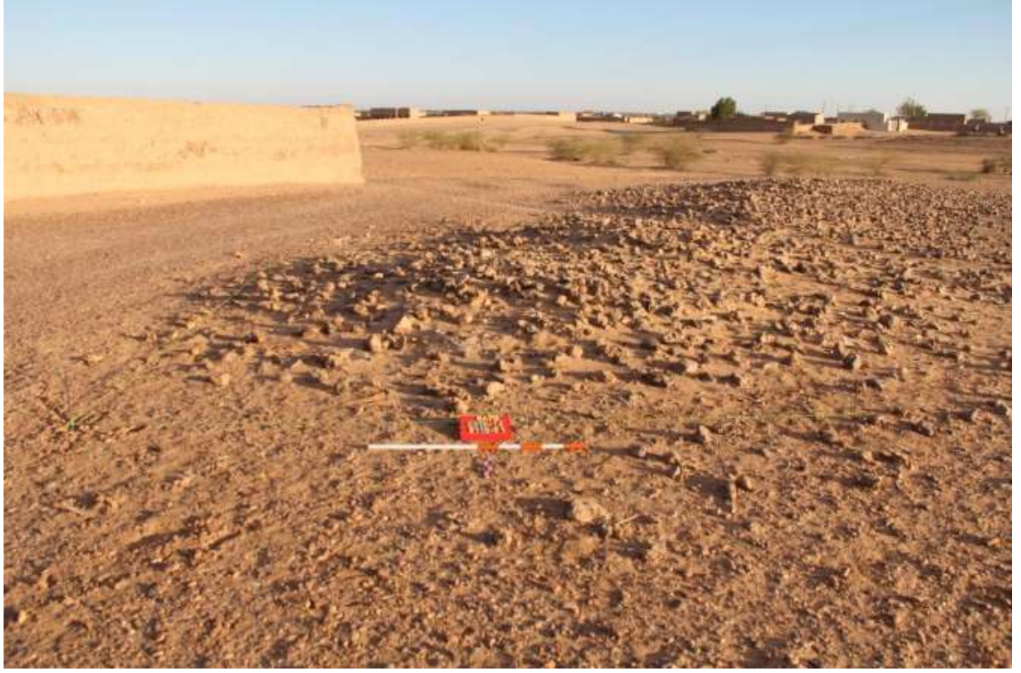
البناء الفوقي لمقابر (E115) العالياب القلعة