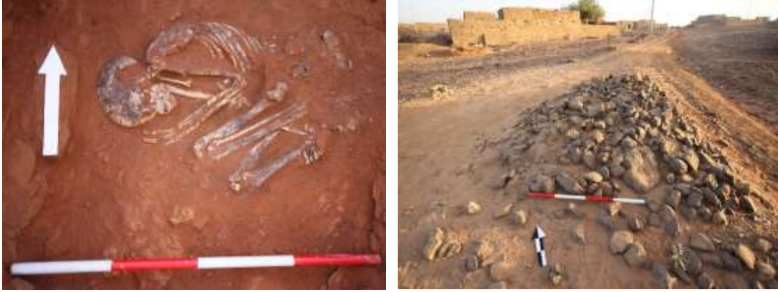
الكوم الخارجي وحفرة الدفن بمقابر (E040) العوضاب المحمية

يتكون هذا الموقع من أكوام صغيرة تقع بقرية العوضاب بالمحمية، وهو مهدد بسبب توزيع أراضيه كمواقع للسكن. كل المقابر التي تم تنقيبها وجدت خالية إلا من بعض قطع الفخار والعظام الصغيرة التي عثر عليها ضمن مواد الأكوام العلوية. يستثنى من هذا، قبر واحد وجد المتوفى فيه في وضع مقرص على الجانب الأيمن، على اتجاه شرق- غرب.