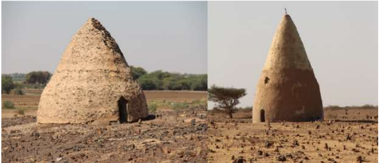
قبة الشيخ أبوسبيب بالمطمر المحمية شرق