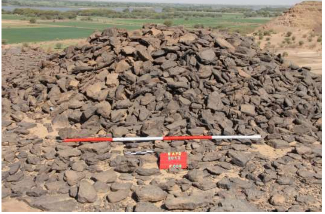
مقبرة بموقع الشطيب المحمية (E008) لعصر ما بعد مروحي بقمة جبل